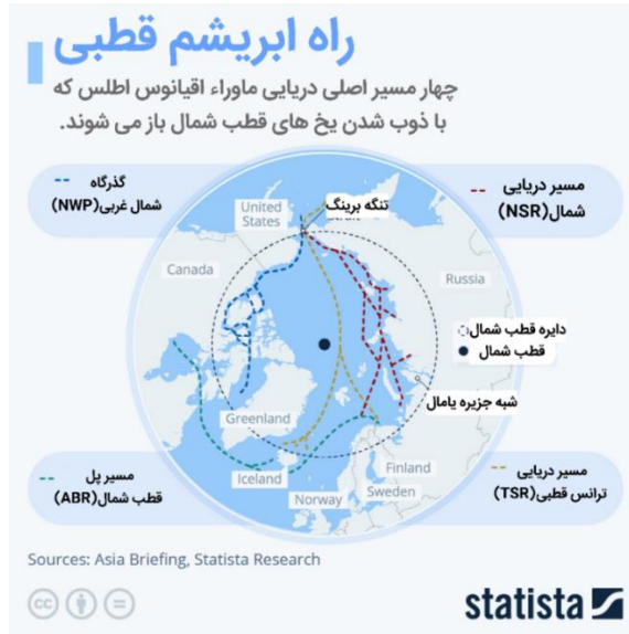
تصویر شماره ۲: نقشه راه ابریشم قطبی (Statista, 2023)

روسیه در نظر دارد از راه مشارکت روس اتم ۱ با شرکت اماراتی DP World به بازسازی بنادر ولادی وستوک ۲ و مورمانسک ۳ دست بزند. این امر زمینه‌ای را فراهم خواهد کرد که روسیه به‌عنوان یک بازیگر کلیدی و استراتژیک در منطقه معرفی شود، زیرا این بنادر قابلیت انتقال منابع از کشتی‌های کلاس یخی به کشتی‌های معمولی را دارند. همچنین روسیه در نظر دارد برای توسعه این پروژه، فرودگاه‌هایی مانند آمدرما ۴ را در غرب و پیوک ۵ ، چرسکی ۶ و کپریم ۷ را در شرق راه‌اندازی کند (Mills, 2022).