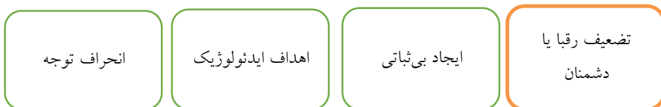
شکل ۱: اهداف استفاده ابزاری از تروریسم