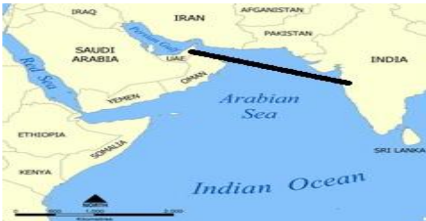
نقشه ۱: موقعیت جغرافیایی هند و امارات متحده عربی نسبت به یکدیگر

در این پژوهش، در چهارچوب نظریه وابستگی متقابل، کوشش می‌شود نشان داده شود که هندوستان با رویکردی مبتنی بر استفاده از قدرت نرم در عرصه اقتصاد، پیشبرد اهدافی همچون حفظ موازنه قوا در برابر چین، گسترش فرهنگ هندی در منطقه خلیج فارس و ایجاد عمق استراتژیک در برابر پاکستان را دنبال می‌کند. این پژوهش از آنرو اهمیت دارد که در قالب پژوهش‌های انجام‌شده در حوزه مطالعات منطقه‌ای در ایران، تاکنون به آن پرداخته نشده است و از آنرو ضرورت دارد تا با تبیین و شناخت رویکرد هندوستان نسبت به امارات متحده عربی، سیاست‌گذاری‌ها در حوزه دیپلماسی اقتصادی در ایران ارتقاء بیشتری یابند.